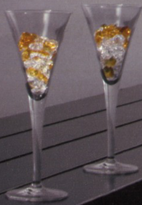
REFLEX - Alessandro Lenarda design